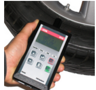
VT55 Le plus puissant