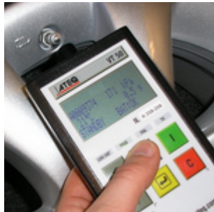
VT50 Facilité d'utilisation