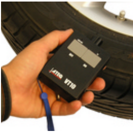
VT10 1 à 4 touches préréglées