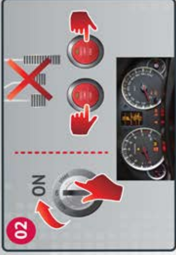
02 Turn ignition ON, engine OFF Gire la llave del motor a la posición "Encendido", sin arrancar el motor.