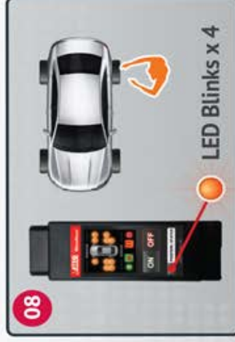
08 Trigger Left Rear sensor Active el sensor trasero izquierdo