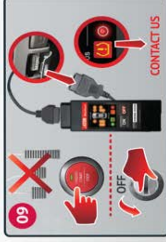
09 Turn ignition OFF, remove MitsuReset Gire la llave del motor a la posición "Apagado". Desconecte el MitsuReset.

The Mitsureset is designed for Mitsubishi Lancer, Outlander, Outlander Sport and Mirage only! Using the MitsuReset on other makes or models might damage the vehicle or the tool.