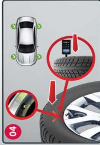
04 Position the trigger tool Posicione el MitsuReset segun se muestra en la figura