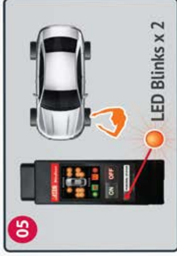
05 Trigger Left Front sensor Active el sensor delantero derecho