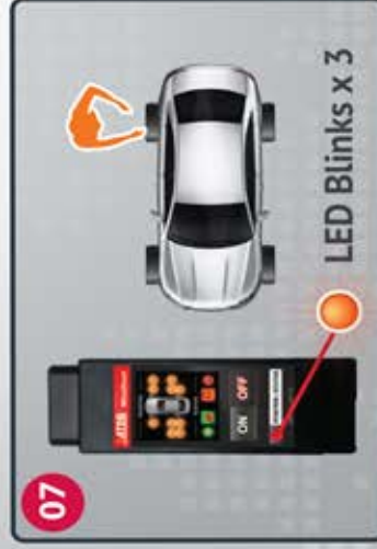
07 Trigger Right Rear sensor Active el sensor trasero derecho