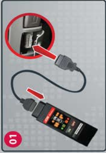
01 Connect MitsuReset to OBDII. Conecte el MitsuReset al conector OBDII.