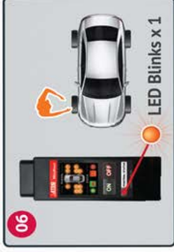
06 Trigger Right Front sensor Active el sensor delantero izquierdo